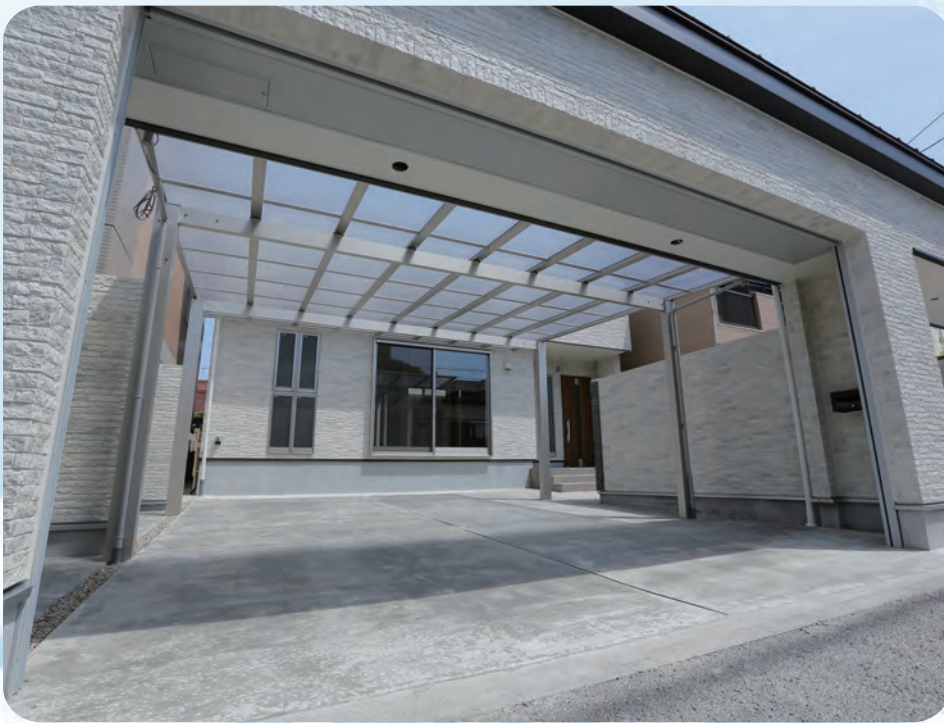
木造 2 階建住宅 Y 邸