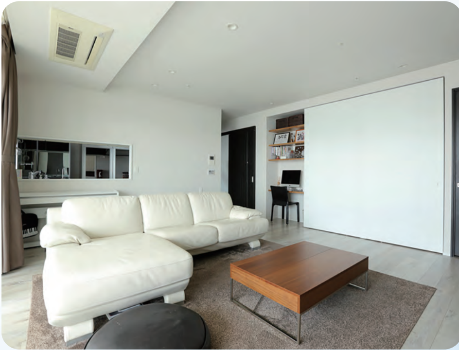
熱田ミッドキャピタルタワー