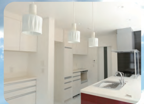
木造 2 階建住宅 Y 邸